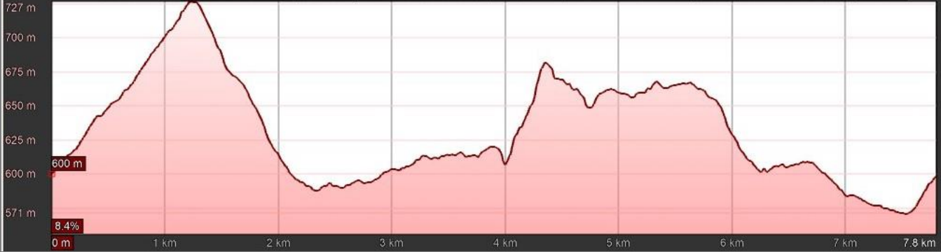
Gráfico: min., media, máx. Elevación: 571, 631, 727 m Total de intervalo: Distancia: 7.8 km Incremento/pérdida de elevación: 330 m, -331 m Pendiente máxima: 37.4%, -26.6% Pendiente media: 7.9%, -8.1%