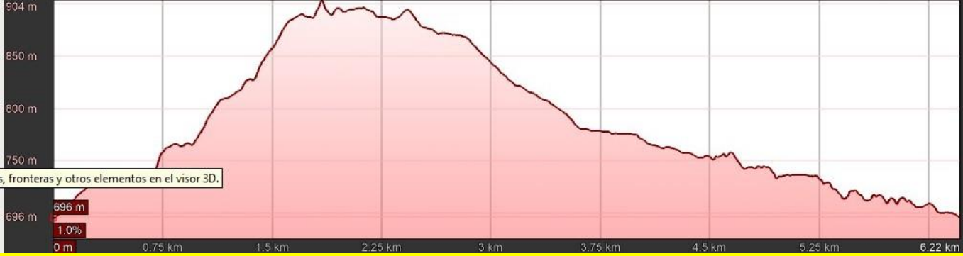
Gráfico: mín., media, máx. Elevación: 696, 788, 904 m Total de intervalo: Distancia: 6.22 km | Incremento/pérdida de elevación: 329 m, -328 m | Pendiente máxima: 43.3%, -32.6% | Pendiente media: 10.9%, -8.4%

fronteras y otros elementos en el visor 3D.