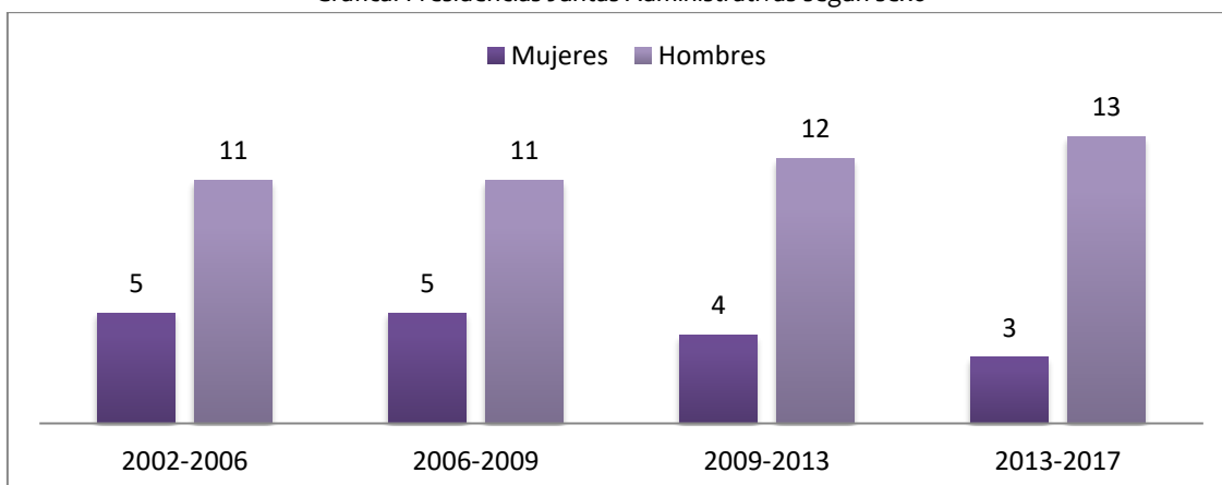
Gráfica: Presidencias Juntas Administrativas según sexo

En cuanto a los datos que hacen referencia a las Juntas Administrativas, la proporcionalidad entre mujeres y hombres se ha mantenido en un 31% de mujeres y 69% hombres hasta el año 2009, donde la proporción de ellos ha ido en aumento hasta llegar al 81% en las elecciones de 2013.