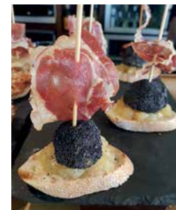
Pintxos Bar-Restaurante Artzegi.