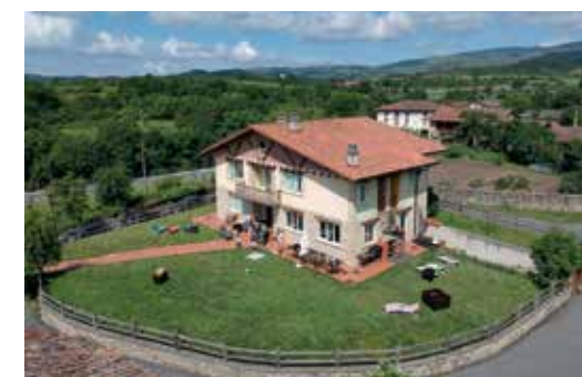
Casa Rural Quopiki.