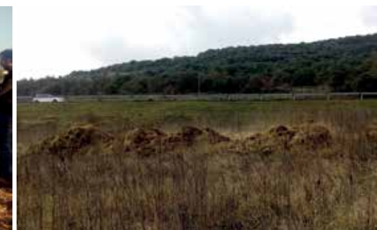
Pila de volteo. Sistema en el que se amontona el material, se mezcla y se voltea periódicamente.