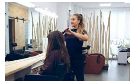
Ziar Centro de Belleza.