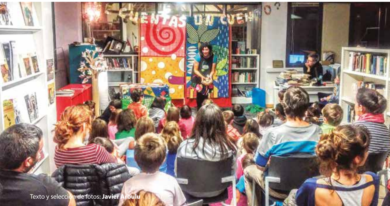
Texto y selección de fotos: Javier Arbulu

El joven fotógrafo, la Sociedad Etnográfica Abadalaueta y escolares, padres y madres de Gorbeia Eskola son algunos de nuestros protagonistas esta primavera. Con permiso de los libros, naturalmente.