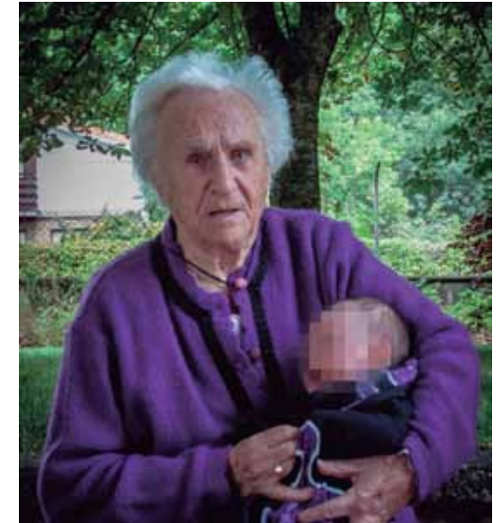
La tatarabuela y el tataranieto.