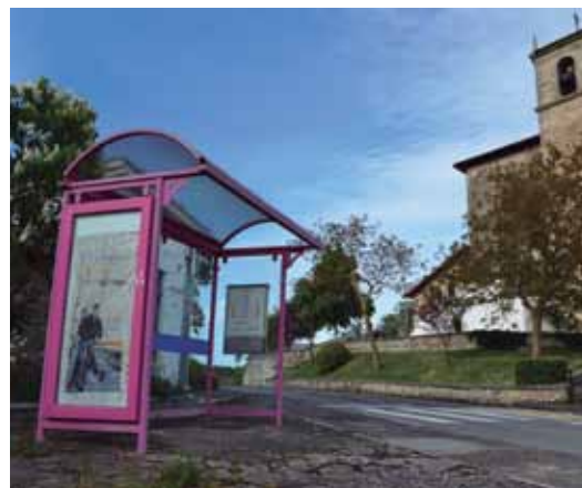
Parada de autobús de Apodaka.

Gasteiz/Zigoitia. A medida que dispongamos de información, desde el Ayuntamiento se informará de los plazos para su puesta en marcha, así como de los cambios que pueda sufrir el proyecto.