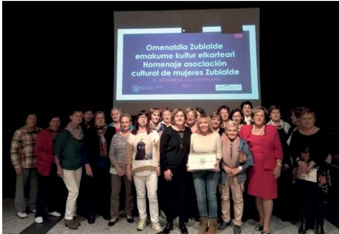
Zubialde Emakumeen Kultur Elkartearen omenaldia, II Berdintasun Jardunaldietan (2017).

Emakume eta gizonen arteko berdintasuna lortu gabeko erronka da, bai Zigoitian bai mundu mailan. Emakumeok, egunero, sexu indarkeria ezberdinak pairatzen jarraitzen dugu. Guztien artean gogorrena, emakumeen eta beren seme-alabengan egindako indarkeria fisikoa dugu. Hori dela eta, ezinbestekoa da borrokatzen eta ekimen ezberdinak sortzen eta garatzen jarraitzea. Esate baterako, Zigoitiko Jardunaldi Feministak, duela hiru urtetik hona urriaren erdian gure udalerrira iristen direnak.