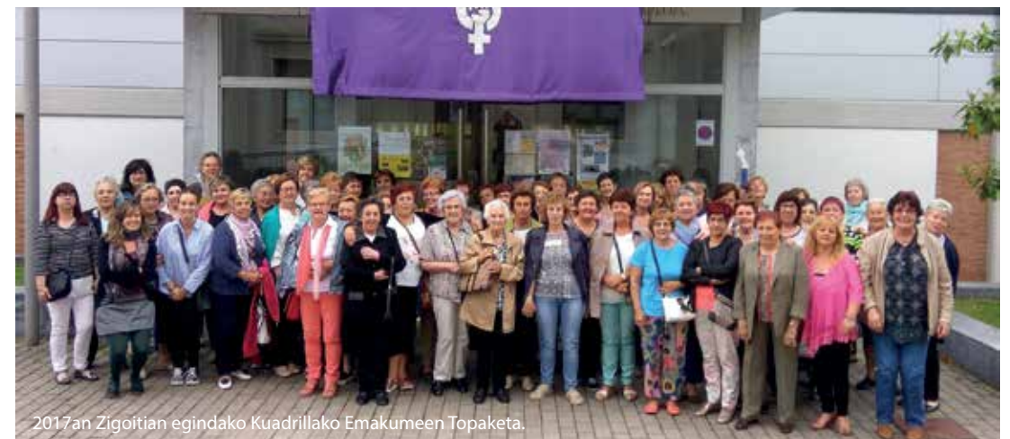
2017an Zigoitian egindako Kuadrillako Emakumeen Topaketa.

Info +: Berdintasun zerbitzuaren informazioa jaso nahi duzu? Ekintzak, hitzaldiak, tailerrak... Jarri gurekin harremanetan e-posta honetan: berdintasuna@gorbeialdea.eus