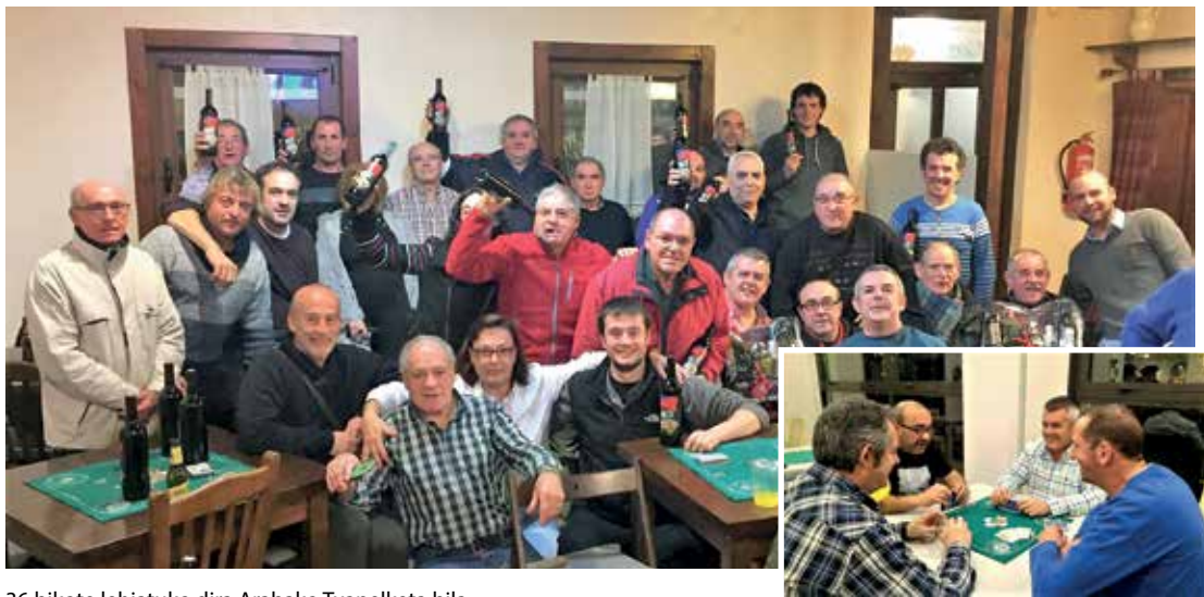
36 bikote lehiatuko dira Arabako Txapelketa bila.

Otsailaren 24an egingo da, lehenengo aldiz Zigoitian, Arabako Mus Txapelketa